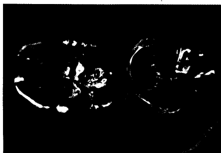
Konventionelle K+B-Befestigungen mit Ketac-Cem (Seite 32)