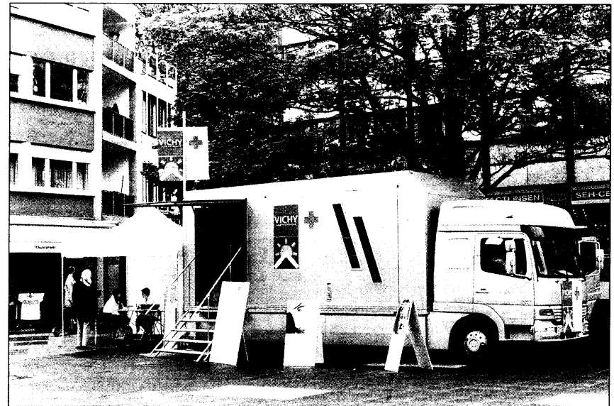
Das Hautschutzmobil des Deutschen Grünen Kreuzes steht auf dem Theaterplatz in...