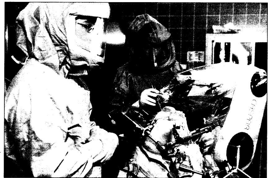
Operateure implantieren Knieprothese mit Roboter

wandern, im Vergleich zu Sport-Muffeln ein um 62 Prozent geringeres Risiko für ein Ulcus duodeni, berichten die Forscher. Bei Männern, die zwar Sport treiben, aber mit geringerer Intensität, ist das Risiko um 46 Prozent geringer. Eine Assoziation zwischen Sport und Magen-Ulzera bei Männern sowie zwischen Sport und Magen- oder Duodenalulzera bei Frauen gab es aber nicht – bei den