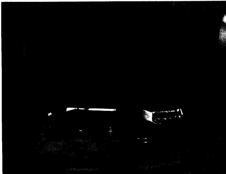
Neue Wege in der Implantatprothetik Seite 8