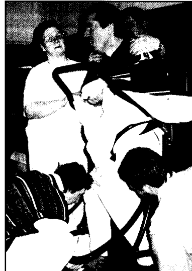
Angehörige und Therapeuten arbeiten zum Wohl des Patienten eng zusammen.