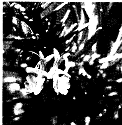
Rosmarin verbessert nicht nur den Geschmack zahlreicher Gerichte, er ist auch gesund. Seine zu den Diterpenen zählenden Phytamine wirken antioxidativ und antimikrobiell. Seite 42