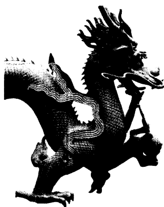
Mit der PZ nach China. Seiten 89 und 123