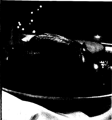
Was Weihnachten auf den Tisch kommt, ist auch im Herbst noch auf den Hüften. Seite 60