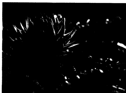
Die Artischocke wird eines der Exponate auf der Weltausstellung in Hannover sein. Denn dort entsteht ein weiterer Apothekergarten, der den Besuchern die Bedeutung der Heilpflanzen näher bringen soll. Seite 65