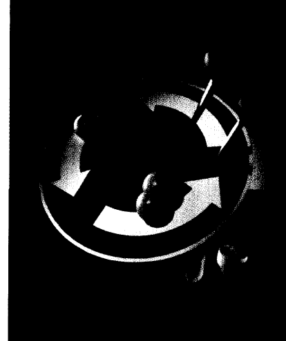
Zytostatika erzeugen reaktive Sauerstoffspezies und blockieren so den Teilungszyklus von Tumorzellen. Seite 11

Expo 2000: Projekt »Der Apothekergarten« 65