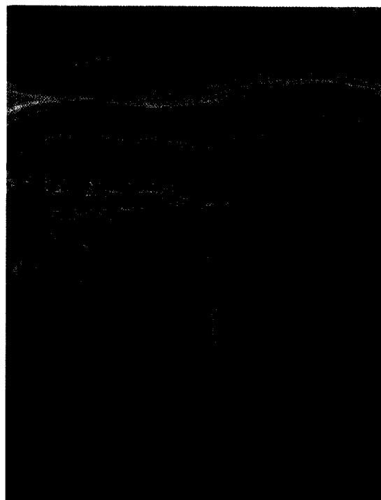
Schmerz behandeln bevor er chronisch wird. (Seite 46 und 49)

© ProLitteris, 2000, CH-8033 Zürich The Munch Museum / The Munch-Ellingsen Group