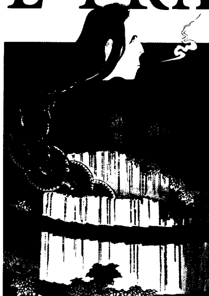
Lesen Sie ab Seite 15 über physiologische und pathologische Veränderungen der Stimme im Alter