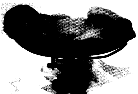
Einen derart gesegneten Schlaf finden die meisten älteren Menschen leider nicht mehr. (Seite 21)