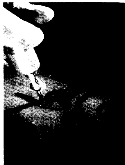
Gefährliche Tattoos: Die Hautverschönerungen bergen ein nicht unerhebliches Nebenwirkungsrisiko