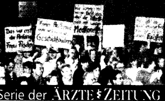
Serie der ÄRZTE & ZEITUNG

(eb). Kontrovers werden auch Politik die Auswirkungen von Leistungsmodellen bei der Integrationsauftrag diskutiert. Bundesge-