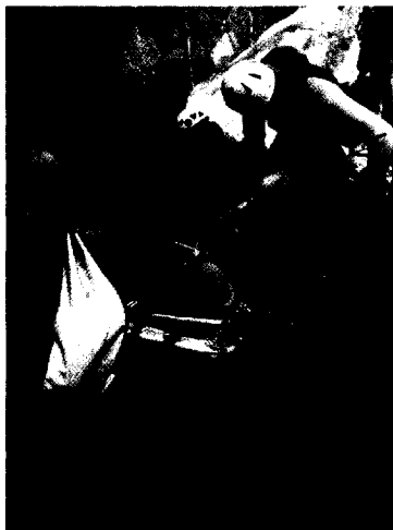
Die terrestrische Bergung eines beatmeten Patienten aus einem Canyon stellt hohe Anforderungen an das gesamte Rettungsteam. (siehe: Notfall aktuell)

Fachnachrichten 249, 256 Buchbesprechungen 241, 247 Kongreßkalender A 17 Autorenrichtlinien A 7 Impressum A 5