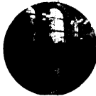
Im Kaffeehaus trafen Bürger die Künstler; Seite 62