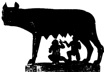
Kapitolinische Wölfin in Rom, 5. Jahrhundert, nur ein spannendes Beispiel aus der Kunst von Jahrtausenden; mehr auf den Seiten 66/67