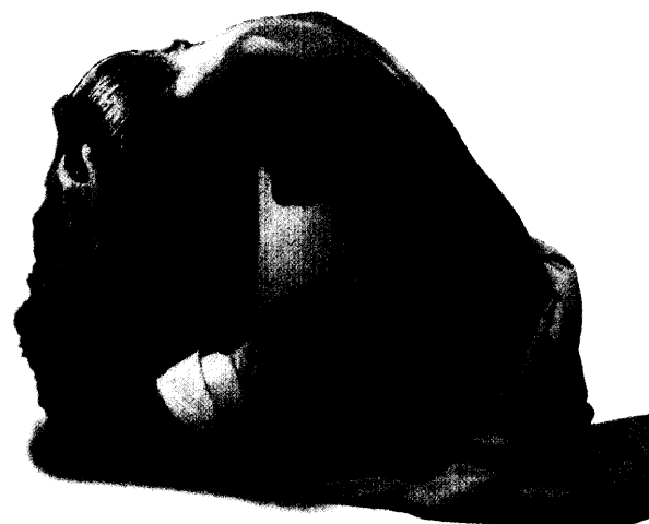
Waves of hairspray reformulations Die neue Welle der Haarspray- Formulierungen