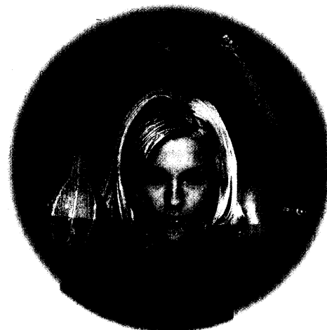
Vegetable fragrance in hair care products: a new trend? Gemüseduft in Haarpflegeprodukten als neuer Trend?