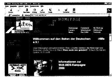
Die Computerpraxis gibt Ihnen diese Woche einen Überblick über Aids im Netz. Seite 89