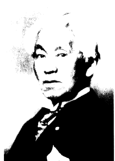
Der Entdecker des Ephedrins, Wilhelm Nagayoshi Nagai, reiste schon um 1860 von Japan nach Deutschland. Dort studierte er und begründete in seinem Heimatland später die moderne Pharmazie. Seite 80.