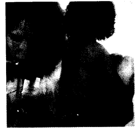
Titelbild: Wolfgang Eckl