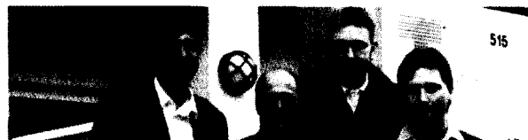
Noch residiert die Heidelberger BioCar GmbH in einem Container-Büro. Vertriebspartner sind sie indes schon für einige der Großen der Biotech-Szene.